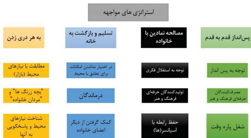
شکل ۲: استراتژی‌های مواجهه با تجربه‌ی «تعلیق استقلال»

زبان‌شناس خوب بسازد یا قارچ‌شناس یا شیمی‌دان: این شدن با آن شدن به او خصوصیتی نمی‌دهد» (نیچه، ۱۳۸۷: ۳۴). برای افرادی که «به هردری می‌زنند» هم تفاوتی چندانی نمی‌کند که از چه راهی به شغلی ثابت برسند، چرا که تخصص و سرمایه‌ی فرهنگی و نمادین خود را از منابعی دیگر کسب می‌کنند.