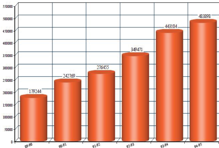
شکل ۱. نمودار ستونی روند افزایش دانشجویان مرد تحصیلات تکمیلی

مرکز پژوهش‌های مجلس گزارشی درباره‌ی پیش‌بینی بیکاری تا سال ۱۴۰۰ منتشر کرده است. ۱ در صفحات ۳۳ و ۳۴ این گزارش آمده است که، بر اساس داده‌های سال‌های ۸۴ تا ۹۲، پیش‌بینی می‌شود که اگر تا سال ۱۴۰۰ نرخ رشد اقتصادی ۱٪ باشد، با چهار میلیون و دویست هزار نفر نیروی تحصیلی کرده‌ی بیکار روبرو خواهیم بود (این برابر با ۴۸/۹٪ نیروی کار تحصیل