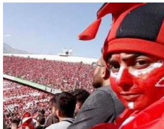
تصور شماره ۱: تمایل زنان برای حضور در ورزشگاه