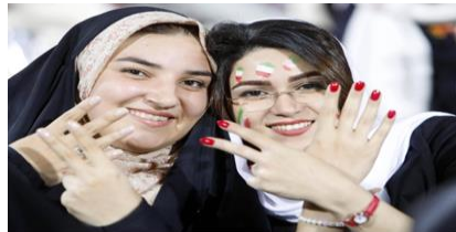
تصور شماره ۳: حضور زنان در ورزشگاه