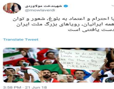
تصویر شماره ۲: تداوم حضور زنان در ورزشگاه